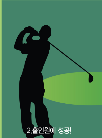
2. 홀인원에 성공!