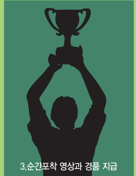
3. 순간포착 영상과 경품 지급