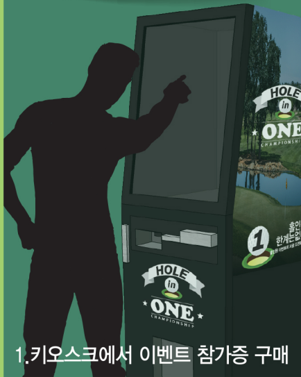
1. 키오스크에서 이벤트 참가증 구매